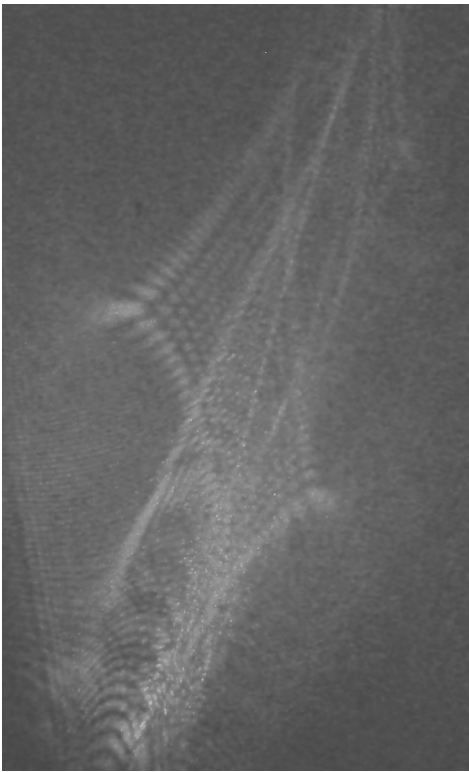
Interferenzmuster bei Beleuchtung von Schaum durch Laser